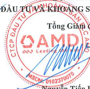
Nguyễn Tiến Dũng

(Các thuyết minh từ trang 10 đến trang 40 là bộ phận hợp thành của Báo cáo tài chính hợp nhất giữa niên độ này)